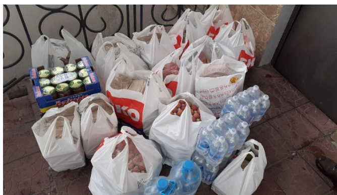
Humanitární zásilka na Ukrajinu